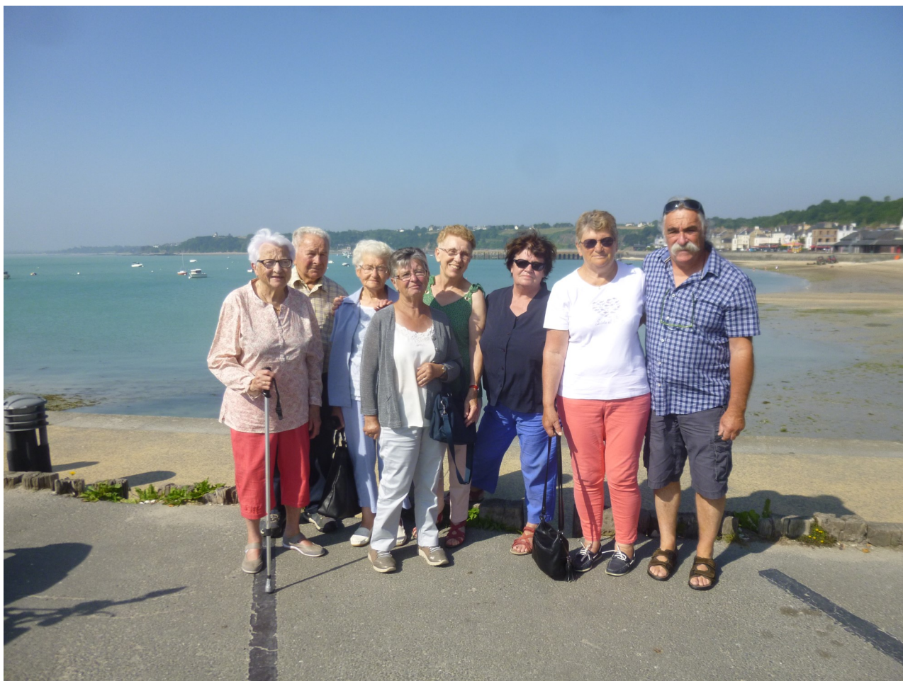
Activité "on sort ensemble" de Juin 2018. De Cancale à Saint-Malo, en minibus.

Pour tous renseignements contacter Fabien VOISIN au 06.89.49.43.45 ou par mail : animationlachapelle-bouexic@gmail.com