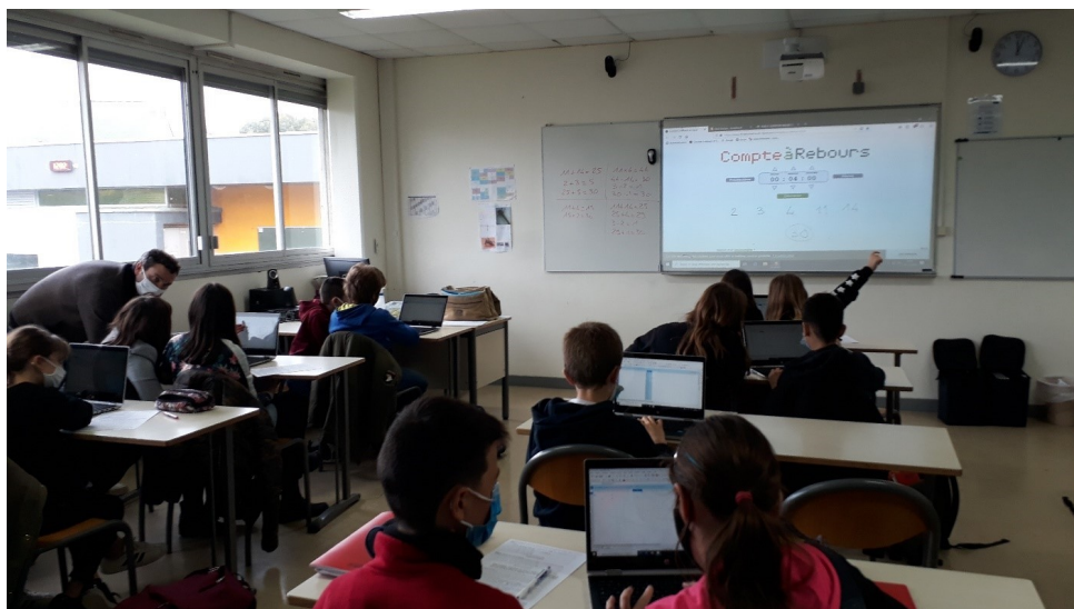
Cours de mathématiques en classe de 6ème.

Notre protocole sanitaire a permis d'accueillir, dès le 18 mai, toutes les classes en même temps. 80 % des élèves ont répondu présents à leurs professeurs qui ont, pendant le confinement, suivi le travail de chacun. Dans le strict respect des consignes sanitaires, nous avons maintenu la remise du diplôme du DNB, les conseils de classe et les rencontres entre parents et professeurs.