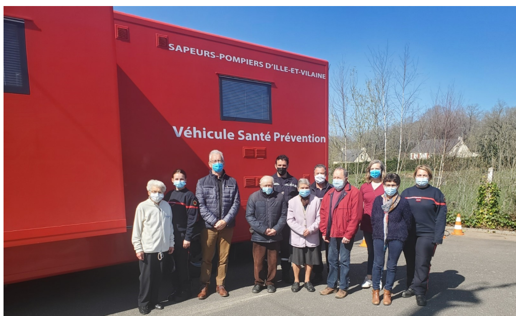
Photo prise lors de la 2ème injection le 23 mars dernier.

Photo prise lors de la 1ère vaccination le 23 Février 2021