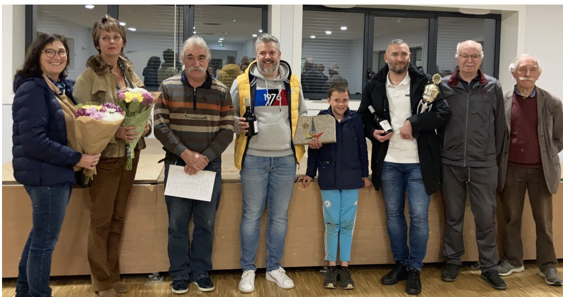
Remise des prix aux équipes gagnantes lors du repas du 29 Octobre dernier à la salle polyvalente.

C'est dans une ambiance très conviviale, que s'est déroulé le tournoi de boules de Mai à Septembre 2021.