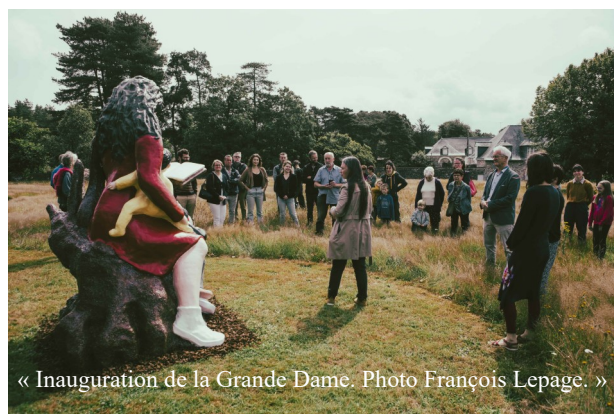
« Inauguration de la Grande Dame. »

L'artiste Mari Gwalarn proposera des ateliers réguliers de pratique des arts plastiques à partir d'octobre 2022, le mercredi pour les enfants (tous âges) et le soir pour les adultes (tous niveaux). Si vous êtes intéressés, pour vous même ou pour vos enfants, contactez la mairie pour vous inscrire ou directement auprès de l'artiste. Mari Gwalarn animera des ateliers également à Guipry-Messac les samedis avec la MJC.