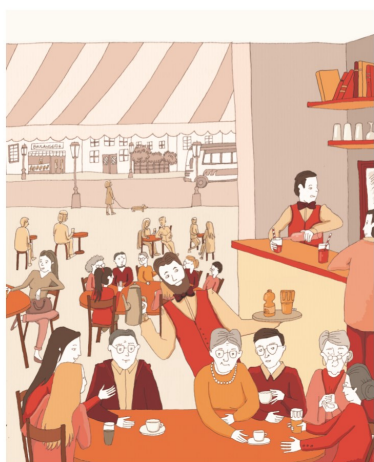
BISTROT MEMOIRE RENNAIS Les français de la mémoire, parlent-en.

L'association Bistrot mémoire rennais s'associe au Chorus pour aller à la rencontre sur le territoire de Val d'Anast des personnes vivant avec des troubles de la mémoire et leurs proches aidants. Un bistrot mémoire est un espace ressources qui permet de dialoguer librement, de partager ses interrogations et ses difficultés dans un climat de convivialité. Il traduit ainsi l'inclusion dans la vie sociale des personnes souffrant de la maladie d'Alzheimer ou d'une maladie apparentée.