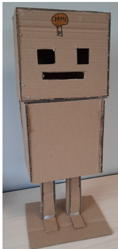
Mr Robot a des idées.

Les ateliers d'arts plastiques du mercredi, à destination d'enfants de 6 à 11 ans, se déroulent depuis le mois de novembre 2022 dans l'espace de convivialité de la salle des sports.