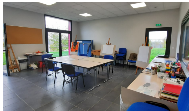
Ateliers du mercredi dans la salle de convivialité

Les très dynamiques participants ne manquent pas d'idées pour rendre le monde meilleur. Pour y arriver, au programme de l'année : dessin, peinture, sculpture, collages, et recycl'art !